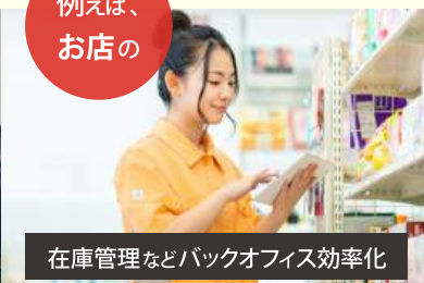
在庫管理などバックオフィス効率化