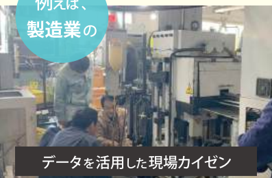
データを活用した現場カイゼン