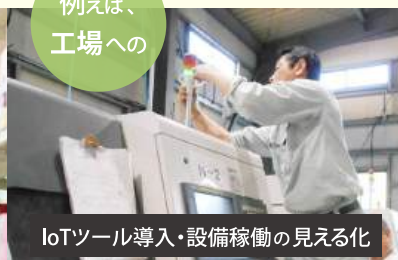
IoTツール導入・設備稼働の見える化